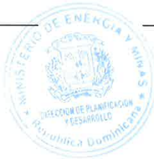
Revisado por Midori Magoshi Encargada Dpto. PPP