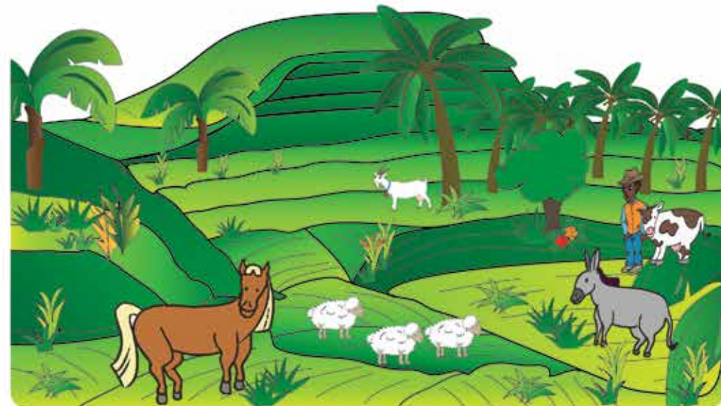
Una vez completada la rehabilitación del área minada