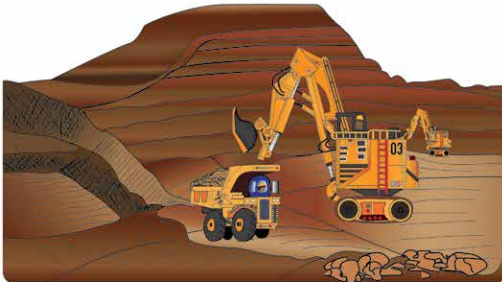
Durante la vida de la Mina

Cuando se cierra una mina la empresa minera debe realizar las acciones necesarias para que quede un ambiente saludable, seguro y apropiado para la vida de las comunidades. Este proceso se llama “rehabilitación”.